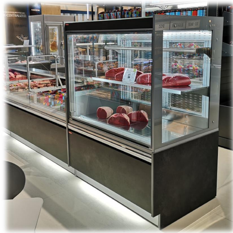
Βιτρίνα Προβολής Συντήρησης MAJOR 2 VD AB 170H