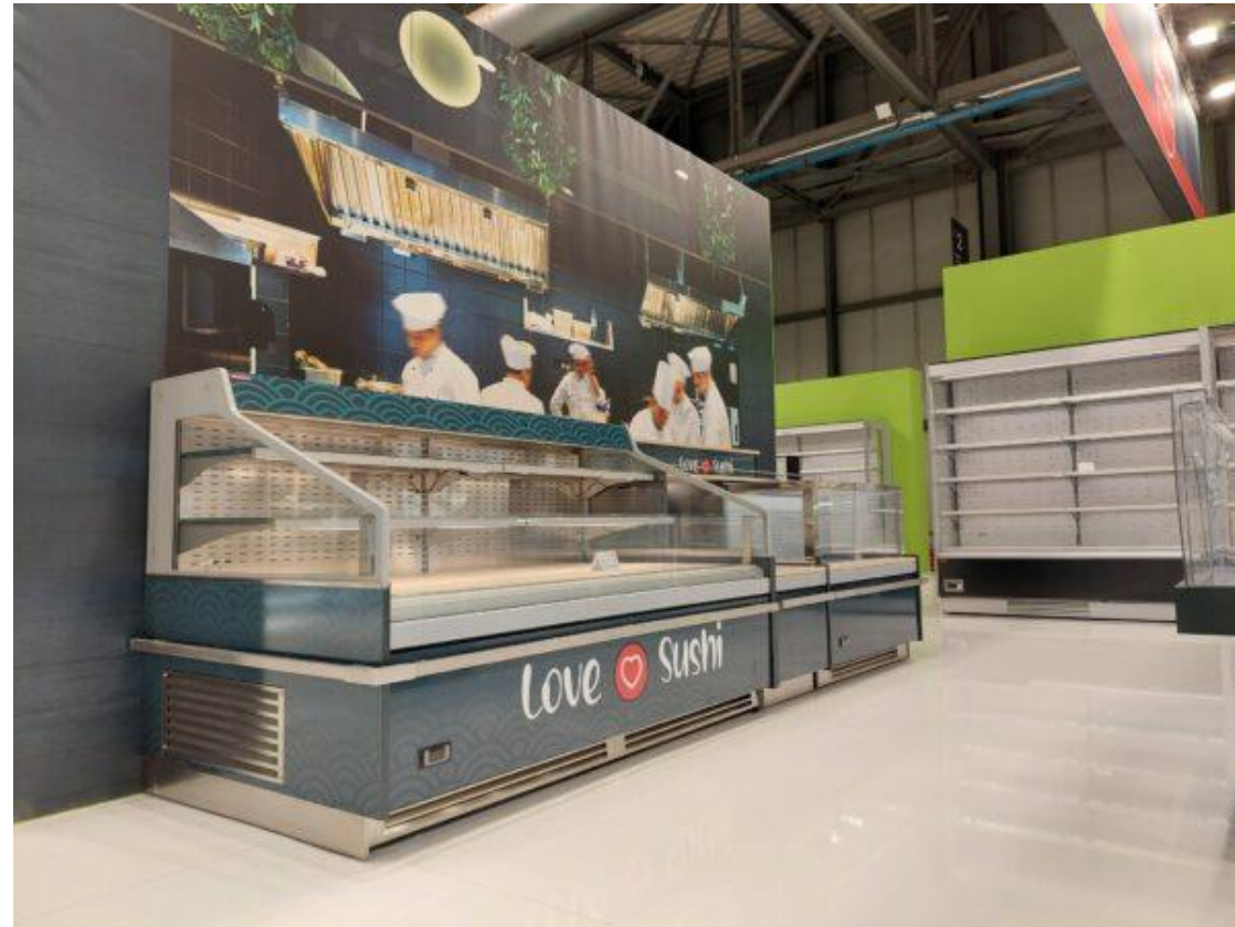
Συντήρηση τοίχου MAJOR 2 VD 120H